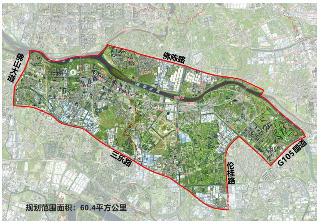
规划范围在现状卫片中的区位示意图