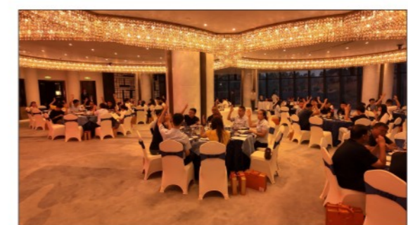
全体员工举手表决

严肃而高效的职工大会结束后，公司为全体员工精心筹备了丰盛的节日晚宴。大家暂时放下工作，在